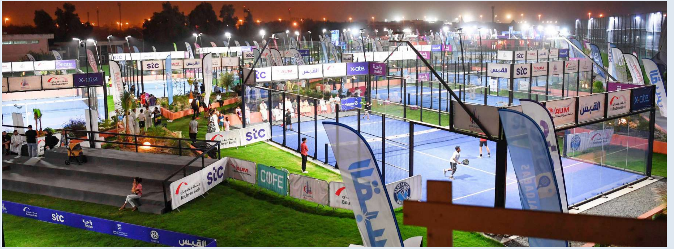
مشهد عام لملاعب وأجواء البطولة