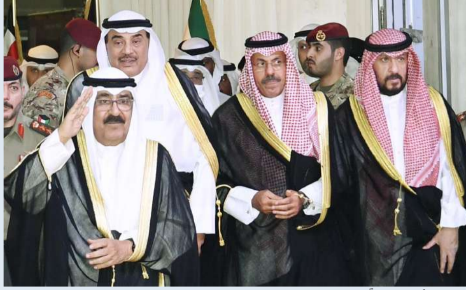
ممثل الأمير محيياً ضباط الإطفاء... ويدا الخالد ووزيرا الداخلية والدفاع

■ الحرس الوطني مؤسسة عسكرية وأمنية عريقة تساند أجهزة الدولة ■ قوة الإطفاء تقوم بأسمى رسالة.. وهي شريك أساسي في أمن المجتمع