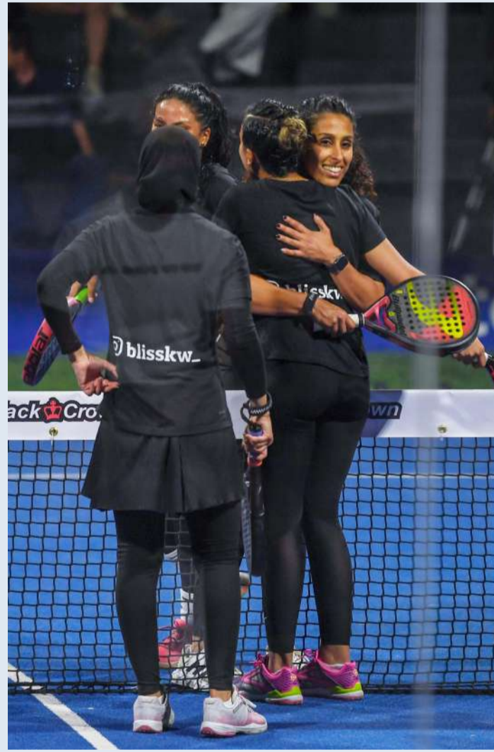
روح رياضية بعد نهاية المباراة