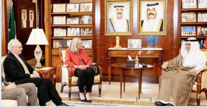
الناصر مستقبلاً المبعوث الأميركي الخاص باليمن

التقى وزير الخارجية الشيخ د. أحمد الناصر في ديوان عام الوزارة امس (الأربعاء) بمبعوث الولايات المتحدة الأميركية الخاص إلى اليمن تيم ليندركنغ بمناسبة زيارته للبلاد. وقدم المبعوث ليندركنغ شرحاً عن آخر المستجدات الحاصلة على الساحة اليمنية، مشيداً بالمواقف الثابتة للكويت لإعادة الأمن والأمان إلى ربوع اليمن الشقيق. من ناحيته أكد الناصر دعم ومساندة الكويت للجهود المبذولة لتأمين استمرار الهدنة والدخول في عملية سياسية شاملة تحقق تطلعات الشعب اليمني الشقيق نحو الأمن والاستقرار، مرحباً في ذات السياق بالتطورات الأخيرة بعد تشكيل مجلس القيادة الرئاسي اليمني. وشدد على أهمية دور الولايات المتحدة الأميركية الصديقة ومساعدتها في إنهاء الأزمة اليمنية ومساعدتها الإنسانية والتنموية للشعب اليمني الشقيق، مجدداً التأكيد على دعم الكويت لكل الجهود التي يقوم بها المبعوث الأميركي الخاص في هذا الإطار.