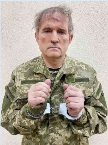
صورة ميدفيدتشوك التي نشرها زيلينسكي

القوات الروسية كييف، لكن بابتهاد القوات الروسية من محيط كييف، بدا أن ميدفيدتشوك أصبح يائساً.