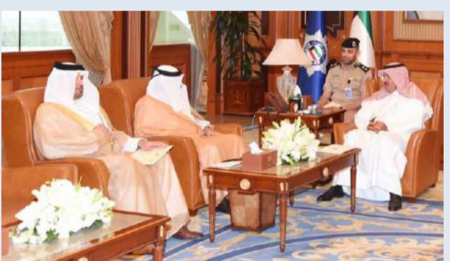
النواف مستقبلاً السفير القطري

الدفع باتجاه تحقيق دعم التعاون الأمني الخليجي.