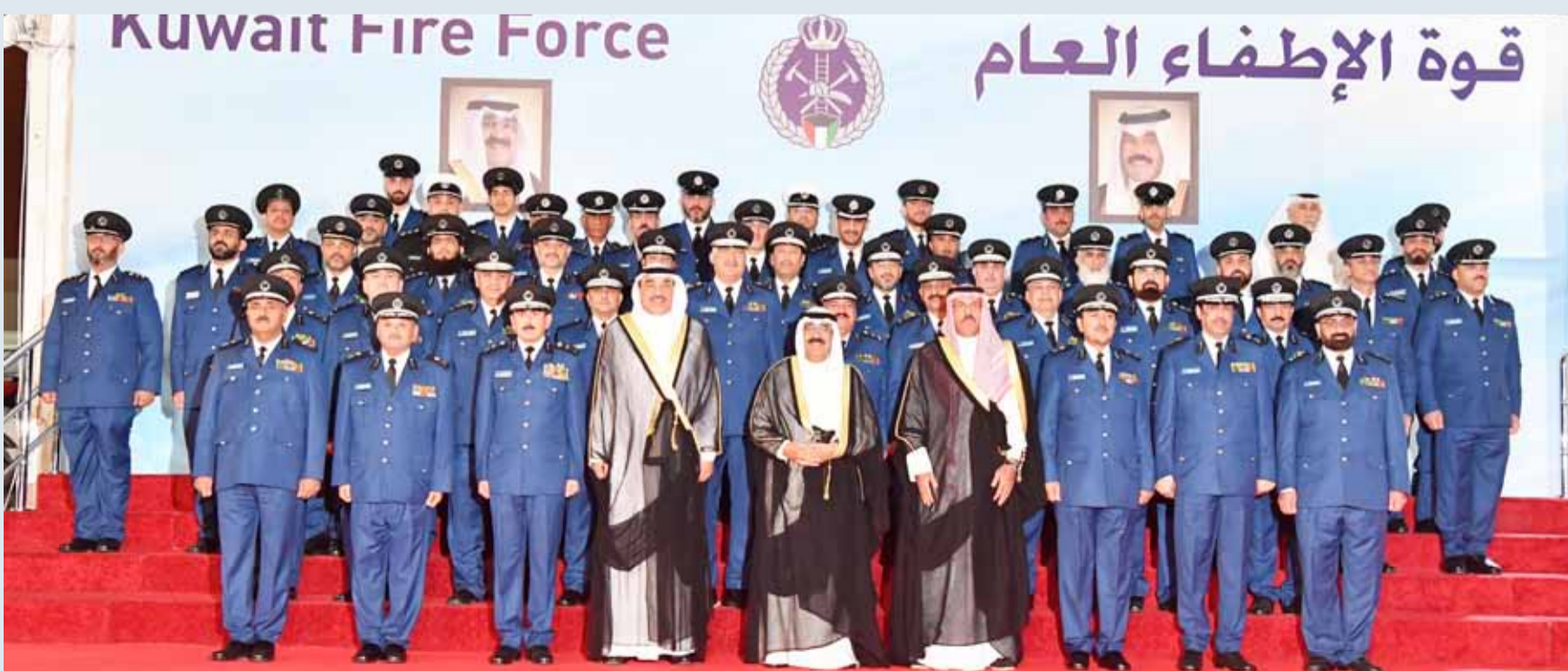
ممثّل الأمير متوسّطاً الخالد والنواف وقيادات قوة الإطفاء

وتابع: سيذكر التاريخ ما تحقّق في الحرس الوطني من إنجازات على أيدي سموكم بمؤازرة سمو الشيخ سالم العلي رئيس الحرس الوطني، فبصمات سموكم لا تنكر وإسهاماتكم ستظل على الدوام تذكر. وخاطب الرفاعي سمو ممثّل الأمير بالقول: «وجهتم سموكم إلى تشجيع الشباب الكويتي على الالتحاق بالحرس الوطني، ورسختم قيم الشفافية والنزاهة ومكافحة الفساد واحترام القانون وأتباع سياسة الباب المفتوح، فشهد الحرس الوطني نقلة نوعية وفقرات هائلة في الشفافية ومكافحة الفساد».