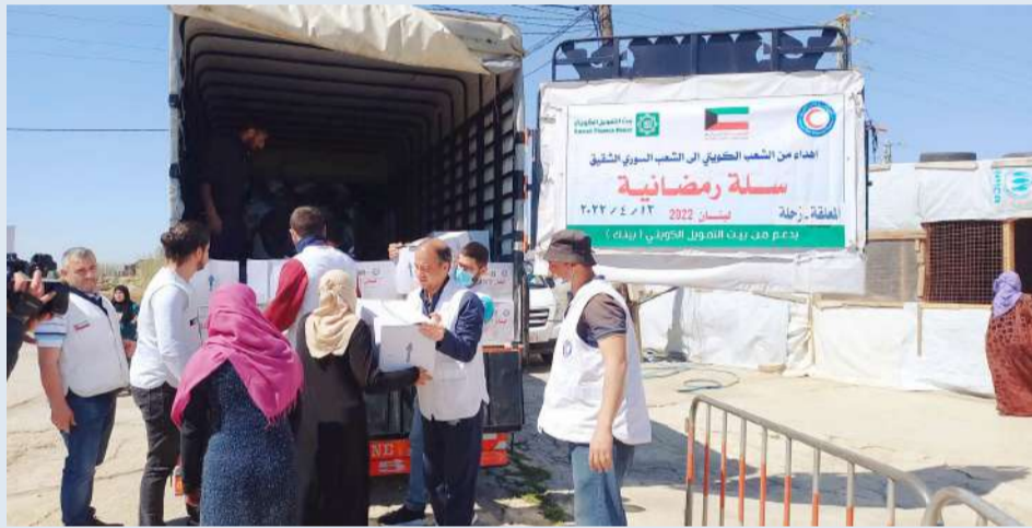
جانب من توزيع مساعدات الهلال الأحمر في لبنان

دعم الاسر اللبنانية واللاجئين السوريين والفلسطينيين عبر مشاريعها المستمرة، وأبرزها مشروع الرغبة.