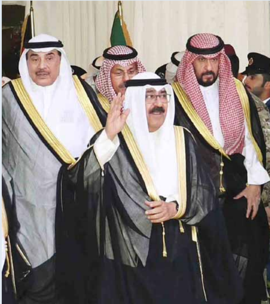
ممثّل الأمير محيياً ضباط الإطفاء... وبدا الخالد ووزيرا الداخلية والدفاع

■ «الحرس» أصبح الحماية والسند لمؤسسات الدولة.. وانتقل إلى مرحلة «الأمن أولاً»