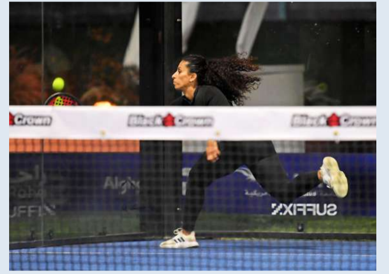
محاولة للحاق بالكرة