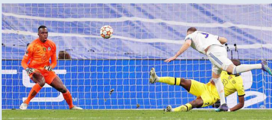
بنزيمة يحرز هدف ريال مدريد الثاني في مرمرى تشلسي

أكدت صحيفة «اليكيب» الفرنسية أن كريم بنزيمة هدف ريال مدريد يتصدر قائمة المرشحين للفوز بالكرة الذهبية 2022، لكن في ظل منافسة قد لا يستهان بها من ساديو ماني وليفاندوفسكي.