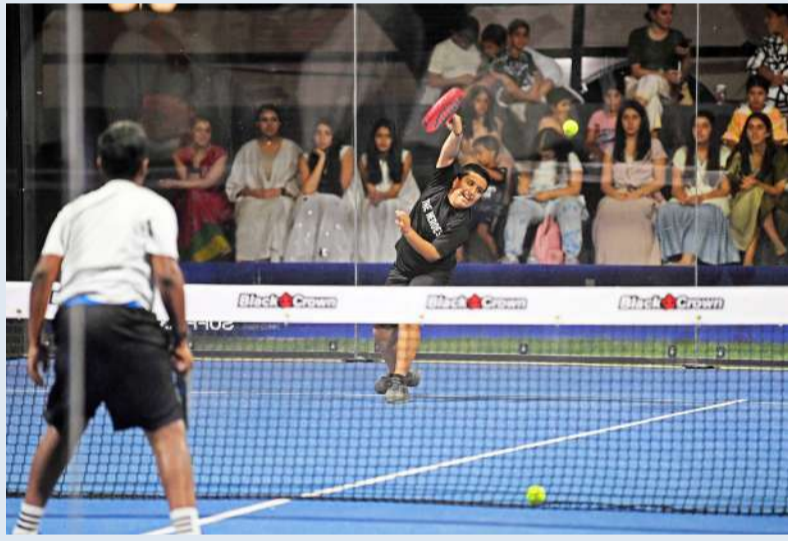
قوة في المنافسات

تواصل اليوم منافسات بطولة القبس الرمضانية الاولى للبادل المقامة حالياً على ملاعب بادل تايم في منطقة العارضية، حيث تبدأ الليلة بطولة المحترفين والمحترفات على يومين، اليوم وغداً (الجمعة)، بإقامة 8 مباريات في الدور الاول فئة المحترفين يمثلون 32 لاعبا، في حين تقام 4 مباريات في فئة المحترفات يمثلن 16 لاعبة، وكشف المشرف العام للبطولة المدير التنفيذي لـ القبس