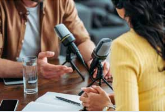
5 مليارات دولار حققها البودكاست والبت المباشر للموسيقى والراديو

وأشار الموقع إلى أنه في ظل مواصلة غالبية وسائل التواصل الاجتماعي تعاقبها على صعيد إيرادات الإعلانات، بعد التراجع الذي شهدته عام 2020 بسبب انتشار وباء كورونا، فإن شركات مثل «ميتا» الشركة الأم لـ «فيسبوك»، عانت من انخفاض في الإيرادات، بسبب التغييرات على الخصوصية التي أطلقتها شركة أبل، والتي أتاحت لمستخدمي أجهزتها خيار منع تتبع بياناتهم بواسطة وسائل التواصل الاجتماعي.