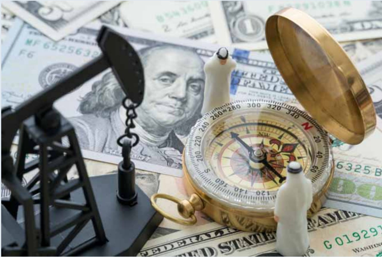
الإيرادات المالية لدول الخليج تأتي من النفط المسعّر بالدولار

قالت الوكالة أن دول الخليج وللحفاظ على ربط عملاتها بالدولار تضطر لاتباع البنك الفدرالي الأميركي في رفع أسعار الفائدة بشكل متتال، ما قد يشكل خطراً على اقتصاداتها. إلا أن ارتفاع أسعار النفط يجنب دول الخليج حالات الركود، ما يوفر لها الكثير من السيولة النقدية لتعزيز الانفاق الحكومي ودعم النمو.