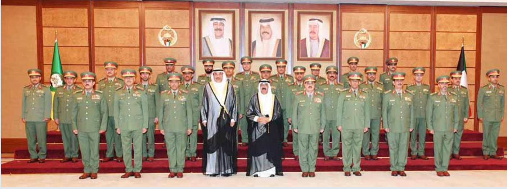
ممثّل الأمير وصباح الخالد مع قياديين وضباط الحرس الوطني

زار الحرس الوطني وقوة الإطفاء وشدّد على استقطاب الشباب الكويتي