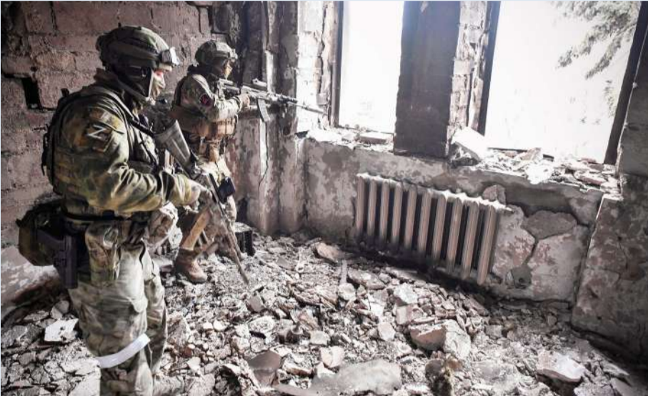
جنديان روسيان يمشطان مبنى مدمراً في ماريوبول المحاصرة

ويتزعم الثري الأوكراني حزب «منصه من أجل الحياة»، الذي يعتبر من أبرز الأحزاب الموالية لروسيا، وكانت التوقعات تشير إلى أنه وحزبه سيكون لهم «دور مهم للغاية» حال انتزاع