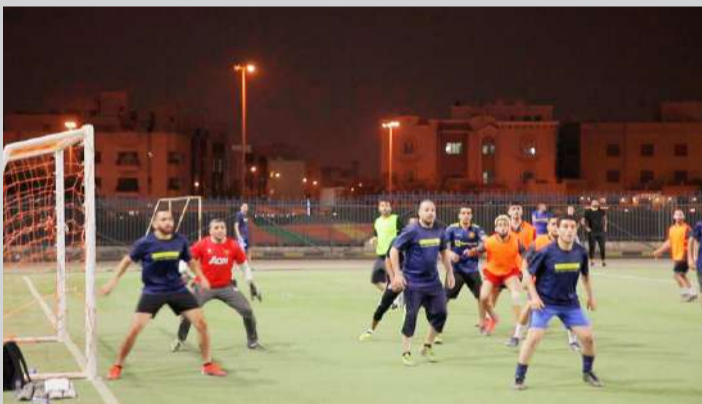
جانب من منافسات البطولة

تواصل فعاليات الدورة الرمضانية الاولى لكرة القدم التي ينظمها اتحاد المكاتب الهندسية والدور الاستشارية الكويتية، في الساعة التاسعة ليلاً وحتى 11 ليلاً لليوم الثاني على التوالي، وتختتم اليوم على ملاعب الهيئة العامة للرياضة بمنطقة السرة.